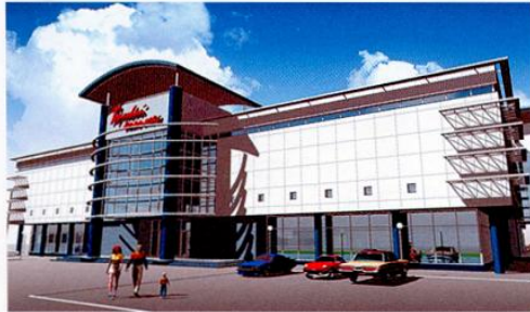
Торговый комплекс в Красноярске