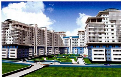
Жилой комплекс «Гремячий лог» в Красноярске