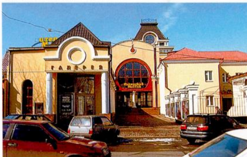
Административно-торговый комплекс «Питерский мостик» в Красноярске