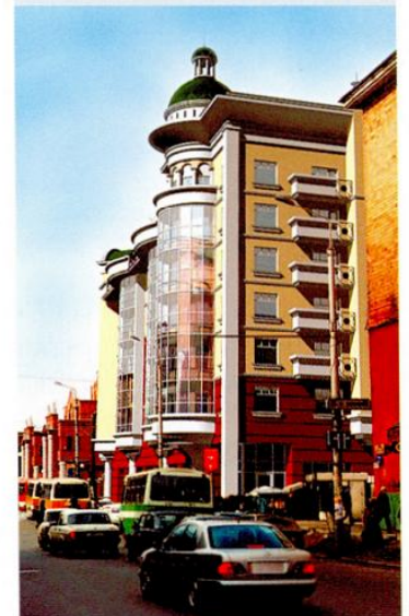
Жилой комплекс фирмы «Артистрой» в Красноярске

При проектировании используется прогрессивный метод монолитного домостроения, позволяющий достигнуть максимального экономического эффекта. В настоящее время по такому методу реализуется проект крупного жилого комплекса «Городок».