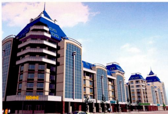
Жилой комплекс «Городок» в Красноярске. Проект и строительство